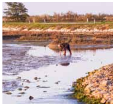
PESCA IN LAGUNA FISHING IN THE LAGOON FISCHFANG IN DER LAGUNE

Before the man-made interventions the original waterfront landscape was characterized by high dunes, still present on the beaches of Cortellazzo and Vallevicchia, that separated the sea from the wetlands further inland. Inland, the areas emerged after land reclamation are for the most part destined to cultivation and characterize the landscape with stunning views as far as the eye can see. The many rivers in Eastern Venice have different nature and origin: apart from the many natural rivers, the region is crossed by artificial canals made over the centuries to support land reclamation activities and to link the inland waterways.