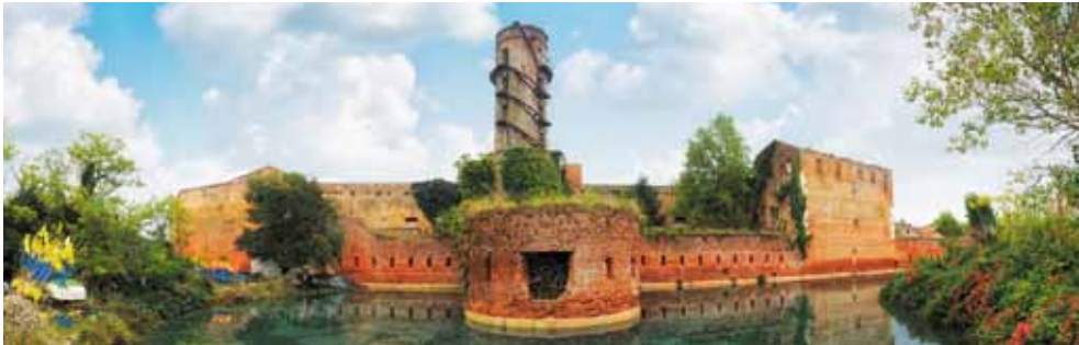
FORTE VECCHIO A PUNTA SABBIONI - FORTE VECCHIO IN PUNTA SABBIONI - FORTE VECCHIO A PUNTA SABBIONI

Environmental itineraries for walking, biking or sailing through the many waterways, food and wine routes, sites of archaeological, historical and natural interest: the I'VE Project promotes innovative and exciting sustainable holiday experiences in Eastern Venice, discovering the nature, history, culture, traditions and local products. A full and varied tourist package that supports and increases the offer of the coast, enhancing the interior in all its striking beauty. I'VE includes the municipalities of Annone Veneto, Ceggia, Cinto Caomaggiore, Eraclea, Fossalta di Portogruaro, Gruaro, Portogruaro, Pramaggiore, San Stino di Livenza, Teglio Veneto, Torre di Mosto and leaders Caorle, Cavallino Treporti, Concordia Sagittaria, Jesolo and San Michele al Tagliamento, responsible for organizing and coordinating the Project's activity. I'VE increases the area's touristic offer by developing new and dynamic cooperation systems between public and private operators with the aim to provide information and services that make the vacation in Eastern Venice more complete, interesting, fun and exciting. From the coast to the inland every month of the year.