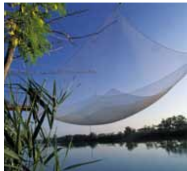
BILANCIA SUL PIAVE FISHNET ON RIVER PIAVE SENKNETZ IM PIAVE

Der direkt am Meer gelegene Teil des östlichen Venetiens wird durch weite Lagunen und sogenannte Valli geprägt, abgegrenzte Wassergebiete und Überbleibsel antiker Lagunen, die teilweise natürlich, teilweise durch Landgewinnungsmaßnahmen zu Beginn des 20. Jahrhunderts entstanden. Die Valli und die Lagunen von Venedig, Eraclea, Caorle und Bibione ermöglichen ein Umweltsystem von besonderer ökologischer Bedeutung, das einen perfekten Lebensraum für wilde Flora und Fauna bietet. Die breiten Sandstrände haben sich durch angeschwemmte Flusssedimente, besonders aus den Flüssen Piave und Tagliamento, in Kombination mit der Wirkung von Wind, Gezeiten und Meeresströmungen gebildet. Vor dem Eingriff des Menschen war die Küstenlandschaft ursprünglich durch hohe Dünen geprägt, die heute noch an den Küsten von Cortellazzo und Vallevicchia vorhanden sind, und das Meer von den sumpfigen Gebieten im Binnenland abgrenzten. Das Landesinnere dient seit der Neuordnung zum größten Teil als Anbaufläche für die Landwirtschaft, deren Felder die Landschaft prägen und herrliche Blicke bis zum Horizont ermöglichen. Die vielzähligen Wasserläufe des östlichen Venetiens sind sehr unterschiedlicher Natur und Herkunft. Abgesehen von den vielen natürlichen Flüssen ist das Gebiet von künstlichen Kanälen durchzogen, die im Laufe der Jahrhunderte als Maßnahme der Urbarmachung sowie als Verbindungswege angelegt wurden.